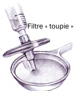
Filtre « toupie »